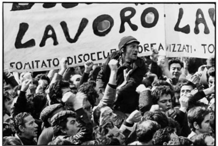
Napoli 1972. Disoccupati organizzati. TANO D'AMICO

△ Tano D'Amico, Le sorelle di Giordiana Masi , Roma 1977.