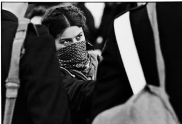
ROMA 1977. Ragazza e carabinieri. TANO D'AMICO

△ Tano D'Amico, Ragazza e carabinieri , Roma 1977.