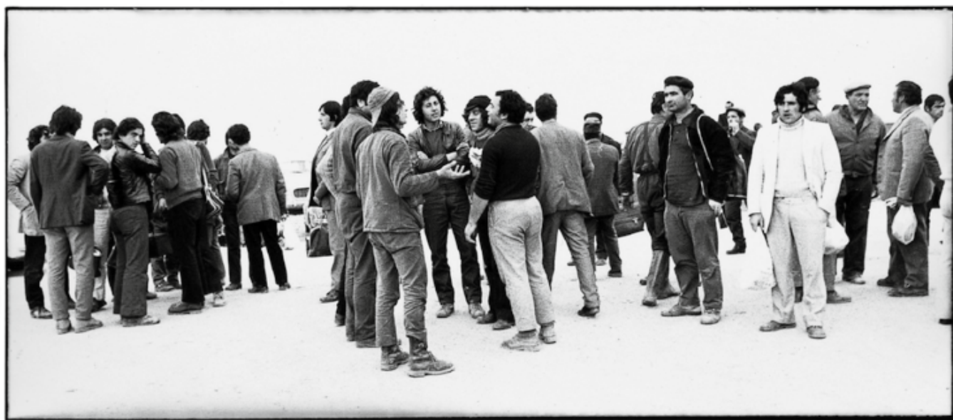
Pendolari sardi, a Porto Torres 1972

▽ Tano D'Amico, Pendolari sardi , Porto Torres 1972.