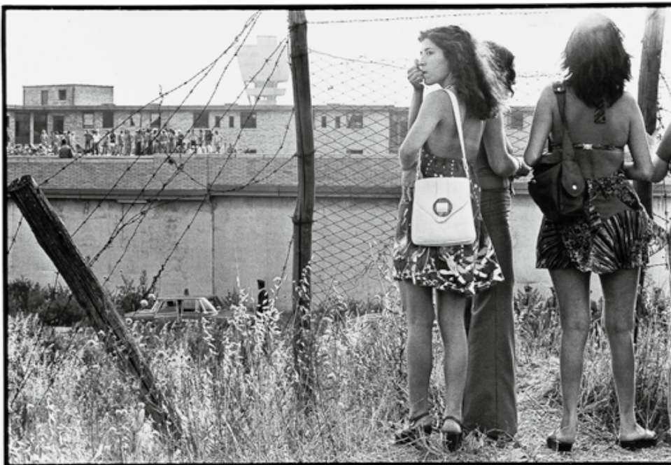
1973 Rivolta a Rebibbia

▽ Tano D'Amico, Rivolta a Rebibbia, Roma 1973.